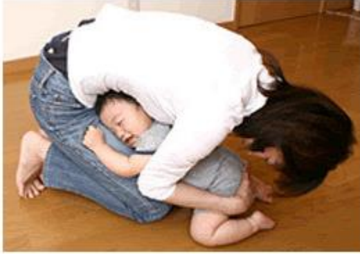
だんご虫のポーズ