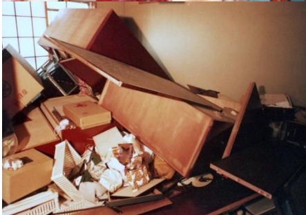
阪神・淡路大震災「1.17の記録」

右下の写真は、タンスが倒れて避難経路を塞いでしまっています。また、ドアも閉まったままなので避難するには困難な状況に陥っています。家具を固定しておくことはもちろんですが、背の高い家具は極力置かないようにしましょう。そして、緊急地震速報が鳴ったら、ドアを開けて避難経路を確保しつつ、頭部を守って下さい。